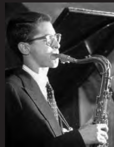
Barney Wilen