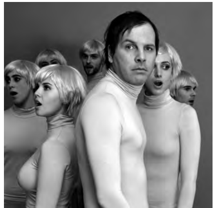
Katerine - ©Valérie Ardenco

www.douzyrockfestival.com - tél. 03 24 27 47 24