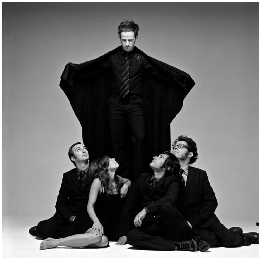
Dionysos - ©Valsson

www.associationflap.org / tél. 06 99 53 74 64