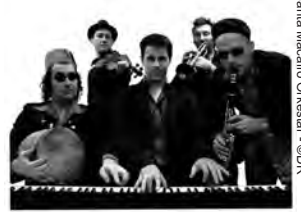
Santa Macario Orkester

www.musiques-ici-ailleurs.com - tél. 03 26 68 47 27