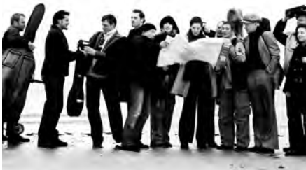
17 Hippiés

http://www.chienaplumes.fr - 03 25 87 04 65