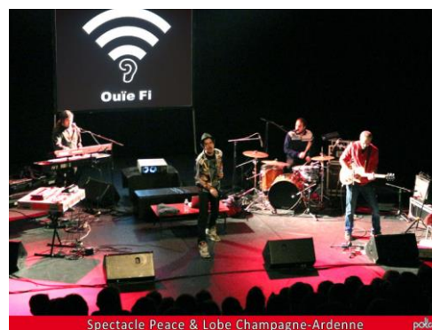
Tableau 4 : Tournée du spectacle pédagogique Peace & Lobe en 2016

Comme chaque année, un temps de reprise de la création est organisé en début d'année scolaire afin de permettre au groupe de retravailler les parties du spectacle qui le nécessitent, en fonction des avis exprimés par les spectateurs la saison précédente. En 2016, plusieurs éléments de compréhension de messages pédagogiques ont été retravaillés ou ajoutés (anatomie de l'oreille, formats de fichiers musicaux), ainsi que plusieurs morceaux originaux. Par ailleurs, ce temps de travail a été mis à profit pour réaliser une vidéo de présentation du dispositif qui devrait permettre de mieux diffuser le projet à l'avenir : https://www.youtube.com/watch?v=JdfllMWuFtE